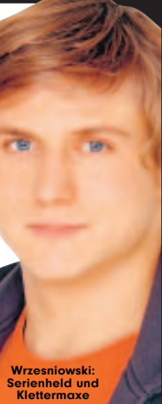
Wrzesniewski: Serienheld und Klettermaxe

Nächste Termine: 9. und 10. Juni, Karten unter Tel. 0341/1268168.