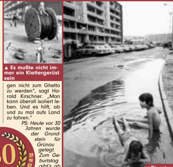
Es mußte nicht immer ein Klettergerüst sein