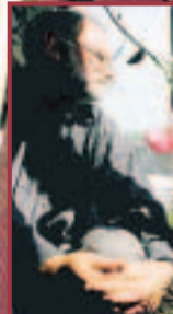
Von seiner Wohnung hoch oben über der Stuttgarter Allee hat er sein Grünau immer im Blick