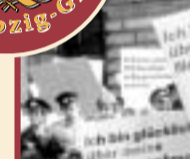
Plakativ zur Schau gestellter Bürgerstolz zur Mai-Demo '89